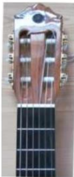
Bild 1 visar gitarrens huvud och några av de första banden. Skulle man visa hela den bilden då ackorden förklarades togs onödigt stor plats och därför används bara den aktuella delen av greppbrädan som du kan se på bild 2 och bild 3