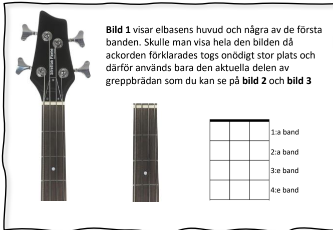
Bild 1 visar elbasens huvud och några av de första banden. Skulle man visa hela den bilden då ackorden förklarades togs onödigt stor plats och därför används bara den aktuella delen av greppbrädan som du kan se på bild 2 och bild 3

För att få en bra ton ska vänstra handens fingrar placeras nära bandstavarna.