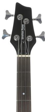
Bild 1 visar elbasens huvud och några av de första banden. Skulle man visa hela den bilden då ackorden förklarades togs onödigt stor plats och därför används bara den aktuella delen av greppbrädan som du kan se på bild 2 och bild 3

För att få en bra ton ska vänstra handens fingrar placeras nära bandstavararna.