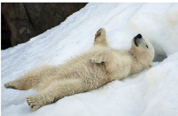
Isbjörn som ligger på rygg i snön